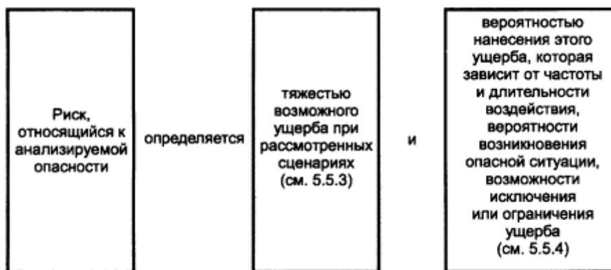
Рисунок 3 - Риск и его составляющие

5.5.2.2 Составляющие риска приведены на рисунке 3.