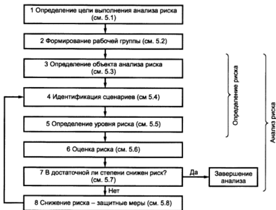
Рисунок 1 - Схема выполнения анализа и снижения риска